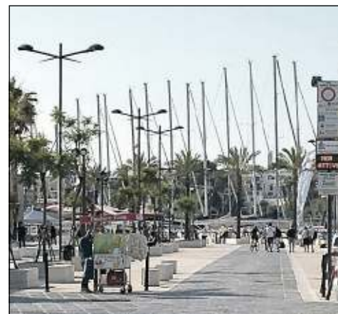
Le barche allineate nel porto interno in attesa della partenza della Regata Brindisi-Corfu prevista mercoledì intorno alle 12