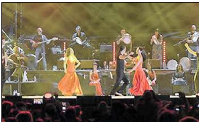
L'orchestra della "Notte della Taranta". In alto: mercatino e negozi aperti in centro

È una città viva quella che si sta ammirando in questi primi giorni d'estate. Ieri negozi aperti per l'intero pomeriggio, con il mercato dell'antiquariato a cornice, e gran passeggio sul lungomare per visitare gli stand del Vinibus Terrae. Un evento questo che di fatto ha aperto il cartellone delle iniziative estive, ieri sera nel foyer del Teatro Verdi si è svolto il «Salotto del Vino». Uno spazio dedicato ad un insolito "walk-around tasting" durante il quale ogni produttore ha presentato alla platea di giornalisti, winelovers ed ospiti istituzionali un vino speciale, una vecchia annata, un vino sperimentale o inedito,